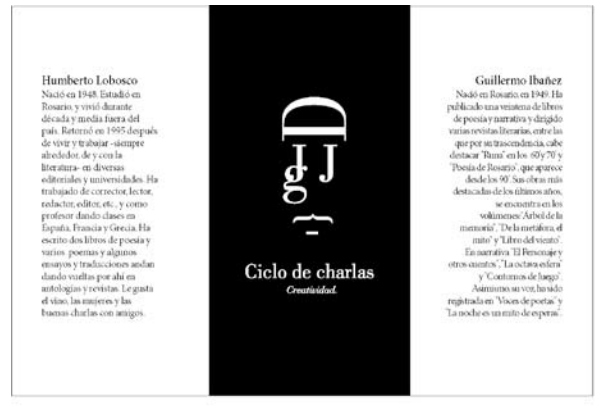
Invitación a la clase de Ibañez y Lobosco.